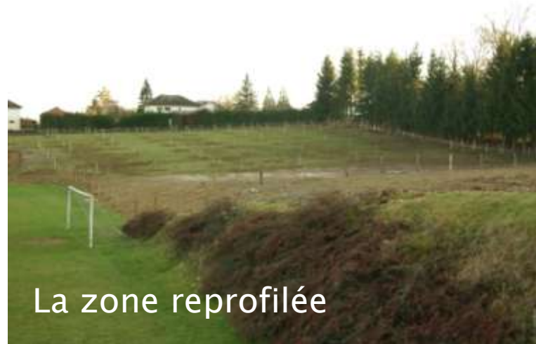
La zone reprofilée