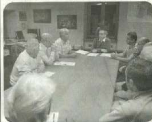
Les statuts de la future association «Les vergers de Trémoins» ont été étudiés

Tél. 03.84.56.85.74 ou e-mail : mairiedetremoins@wanadoo.fr