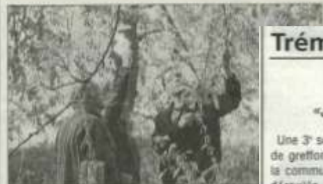
■ Il s'agit de choisir les bons prélèvements.

Les habitants de Trémoins, soucieux de promouvoir le verger biologique, ont participé à l'opération de sauvegarde des arbres fruitiers remarquables locaux.