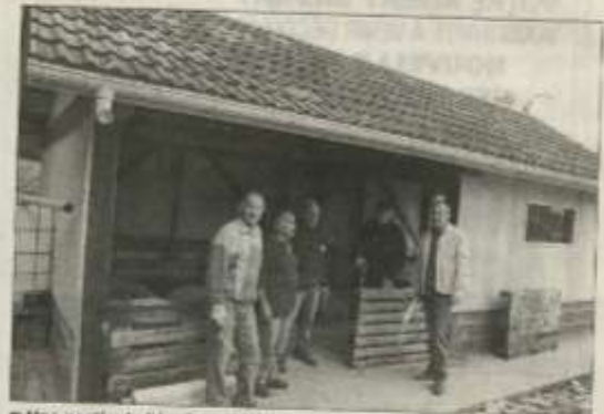
■ Une partie de l'équipe de bâtisseurs de la bergerie.

Seule la plate-forme béton a été réalisée par une entreprise de maçonnerie. Une bergerie rectangulaire de 32