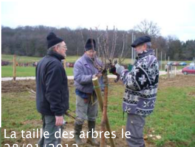
La taille des arbres le 28/01/2012